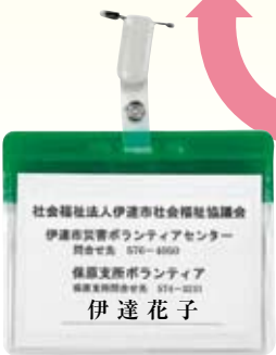
登録証（ネームプレート）