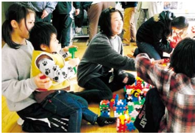
避難所の子供達と、中学生「遊び相手ボランティア」(梁川体育館)

3月17日『災害ボランティアセンター』を伊達市社会福祉協議会本所に設置しました。